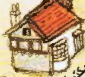
مكتبة كليريس بيلينك